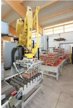
Bild 3: Die Baureihe BEUMER robotpac palettiert und depalettiert mit spezifisch entwickelten Greifsystemen unterschiedlichste Packstücke.