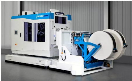
Bild 1: Die BEUMER Group bietet die Produktfamilie des BEUMER fillpac FFS in unterschiedlichen Leistungsklassen an.