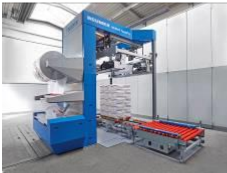
Bild 4: Der BEUMER stretch hood A überzeugt die Kunden insbesondere durch seine einfache, intuitive und sichere Bedienung.