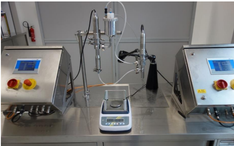
Bild: Versuchsaufbau für die Dosierung von E-Liquids mit einem Dispenser mit Umwälzstutzen