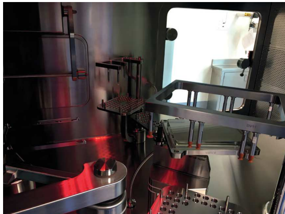
DP-Anlage von innen.