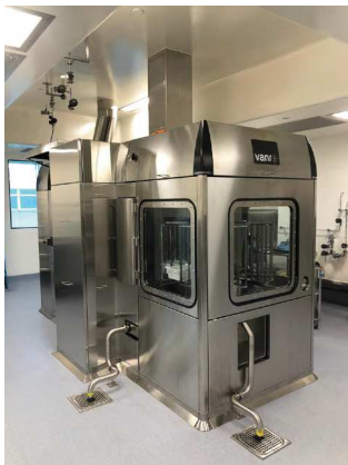
DP-Anlage von außen.

Mit ihrer Idee zum Einsatz von hochautomatisierten und robotischen Systemen, die menschliche Eingriffe im aseptischen Bereich auf ein Minimum reduzieren, überzeugte F. Hoffmann-La Roche die Jury. Angesichts eines sich verändernden Portfolios hin zu kleineren Batchgrößen und zugleich steigendem Auftragsaufkommen, arbeitet das Unternehmen an dem Design einer auf diese Anforderungen zugeschnittenen Produktionsanlage. Ein keimfreier Füllisolator soll das Kernstück auf dem Weg zur DP-Anlage der Zukunft bilden. Das handschuhlose Robotersystem bietet einen vollständigen Füll- und Verschließvorgang vom Einsetzen der Tubs mit den Primärpackmitteln bis zum Entladen der gefüllten und verschlossenen Vials oder Spritzen. Der gesamte Befüll- und Verschließvorgang findet dabei ohne Mitarbeiteringriffe statt. Die Abfüllzelle bietet neue Möglichkeiten und erfordert eine Neugestaltung von Verfahren, die sich über Jahrzehnte etabliert haben. Dabei soll die DP-Anlage unterstützen, indem die einzelnen Fertigungsmodule netzwerk- und standortweit standardisiert werden.