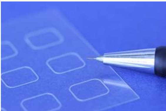
Abbildung 2: Performance einer Mikrodosierung in Perfektion: Der sehr hohe Qualitätsmaßstab spiegelt sich in hochpräzisen Dosierungen wider.

Alle preeflow Komponenten unterliegen höchsten Qualitätsprüfungen. Die volumetrische Dosierpräzision von \pm 1\% und die Wiederholgenauigkeit von starken 99 % lassen sich einerseits auf die exakte Fertigung der Bauteile zurückführen. Andererseits wird die Hochwertigkeit der Produkte nur durch den besonders strengen, internen Qualitätsanspruch an jedes einzelne Element und jedes System erreicht. Für automatisierte Prozesse mit gleichbleibender Qualität und Prozesssicherheit.