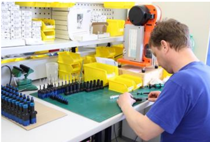
Abbildung 6: Montage einer Charge preeflow eco-PEN im Hauptsitz in Töging

preeflow arbeitet weltweit mit qualifizierten Händlern zusammen, die zum größten Teil seit der Gründung 2008 mit dem Mikrodosiertechnikspezialisten kooperieren. Die Geschäftsbeziehungen basieren sowohl auf jahrelanger, gegenseitiger Unterstützung als auch auf Wissen und Erfahrung. Dank dieser fruchtbaren Partnerschaften profitieren die Kunden von einem sehr hohen Servicegrad: Zuverlässige, qualitativ hochwertige und kompetente Beratung weltweit! Der optionale 24/7 Service & Support sorgt für ein hohes Maß an Flexibilität und Sicherheit.