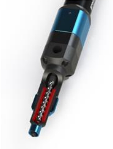
Abbildung 1: Schnittbild eines preeflow eco-PEN