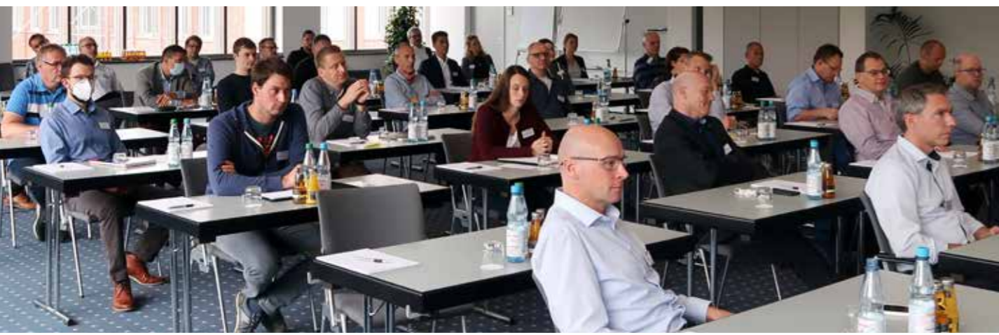
Mehr als 45 Teilnehmer informierten sich über aktuelle Trends im Bereich Containment.

Mit Rottendorf Pharma, ebenfalls in Ennigerloh ansässig, verbindet L.B. Bohle schon seit Jahrzehnten eine sehr erfolgreiche Zusammenarbeit. „Wir rüsten Rottendorf Pharma regelmäßig mit Anlagen für die Tablettenproduktion aus und haben so die Möglichkeit, dort Referenzbesuche durchzuführen. Außerdem unterstützen wir uns bei verschiedenen Themen – vor allem im Rahmen der Ausbildung“, beschreibt Remmert die enge Zusammenarbeit mit dem Lohnhersteller.