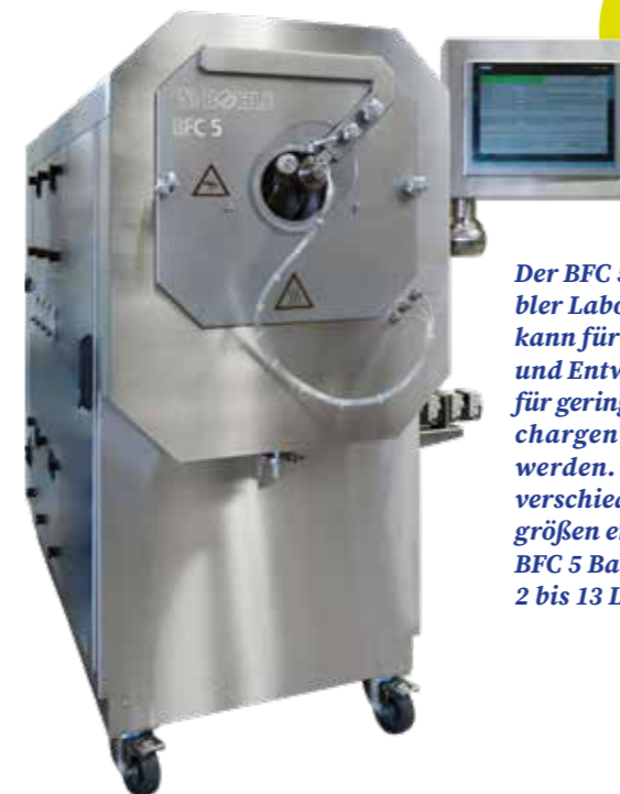
Der BFC 5 ist ein flexibler Laborcoater und kann für die Forschung und Entwicklung sowie für geringe Produktionschargen eingesetzt werden. Durch zwei verschiedene Trommelgrößen ermöglicht der BFC 5 Batch-Größen von 2 bis 13 Litern.