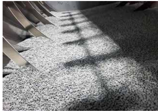
Der BTC 600 garantiert exzellente Produktionsergebnisse. Batchgrößen von 400 – 980 Litern sind realisierbar.

Gezwungen durch die Corona-Pandemie mussten neue Wege zur Maschinenabnahme gefunden werden. L.B. Bohle setzt in Kooperation mit dem Kunden erfolgreich auf einen Livestream und Augmented Reality.