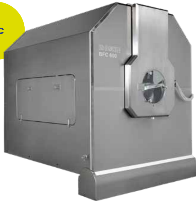
Der Coater BFC ist die High-End-Ausführung aller L.B. Bohle Coater und wurde speziell für schnelles und problemloses Coating entwickelt. Der BFC gewährleistet eine einmalige Gleichmäßigkeit und Effizienz der Tablettenbefilmung.