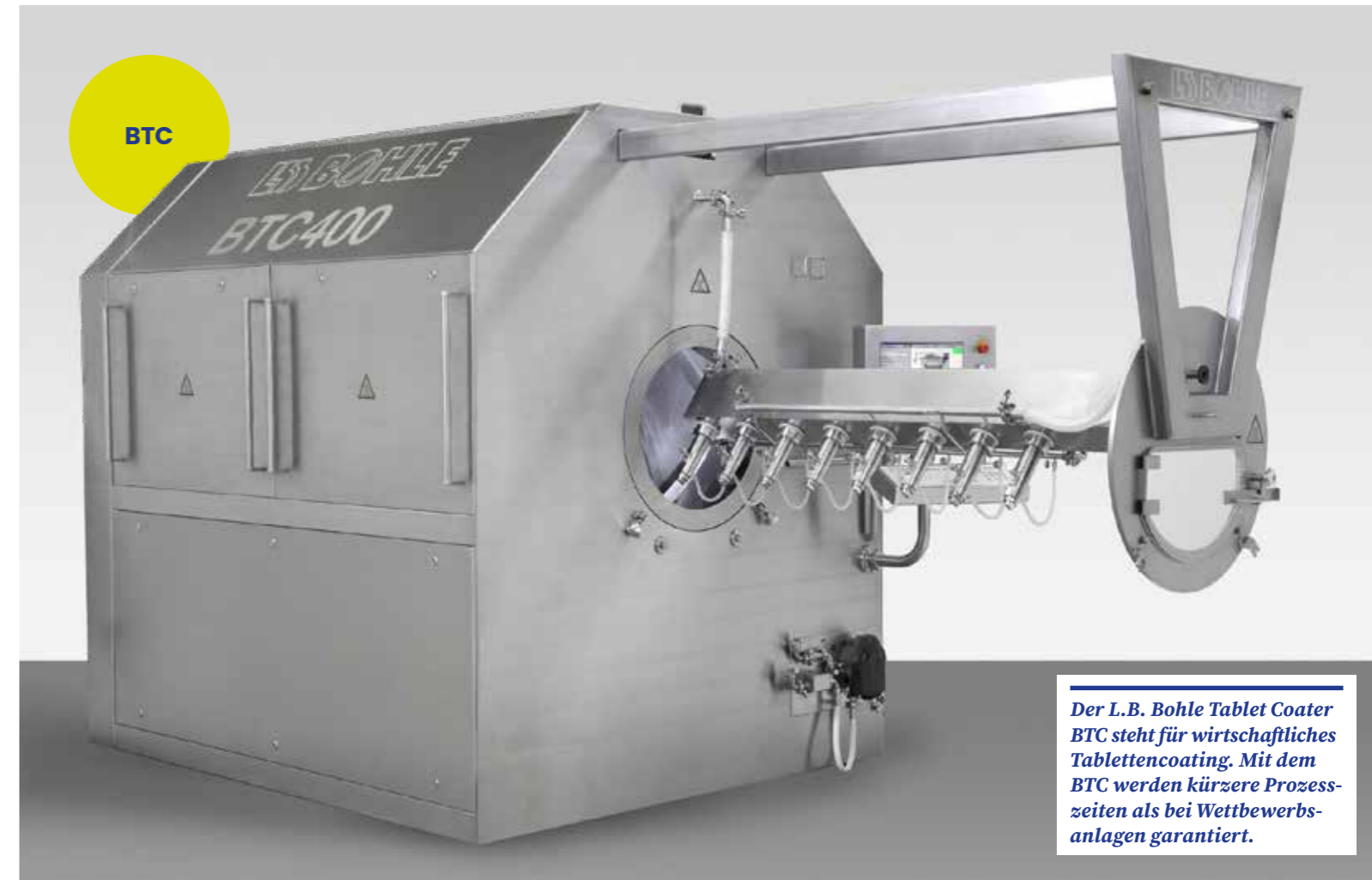
Der L.B. Bohle Tablet Coater BTC steht für wirtschaftliches Tablettencoating. Mit dem BTC werden kürzere Prozesszeiten als bei Wettbewerbsanlagen garantiert.

Die Anzahl und der Umfang von Containmentanwendungen in der Pharmaproduktion stiegen in den zurückliegenden Jahren deutlich. Natürlich bietet L.B. Bohle den BFC auch für Containmentanwendungen an. Nach Kundenspezifikation werden die Coater nach den modernsten Containmentanforderungen konzipiert. Bislang bietet L.B. Bohle Containment-Coater für die OEB-Klassen 1-5 an. Die Containment-Coater verfügen über eine automatische Düsenverstellung, Infrarot-Produkttemperaturmessung, den Anschluss zur Reinigung und Trocknung sowie die steuerungstechnische Integration der Containmentklappen oder über Seitentüren mit aufblasbaren Dichtungen.